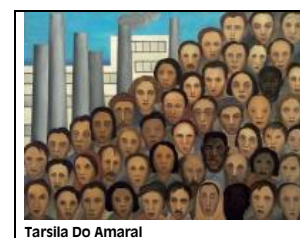
Tarsila Do Amaral

Les étudiants de BTS de R. Mouyal collectent des livres pour une bibliothèque en Guinée Conakry . Vous pouvez déposer vos dons (manuels, romans en très bon état) au CDI pour un départ en janvier.